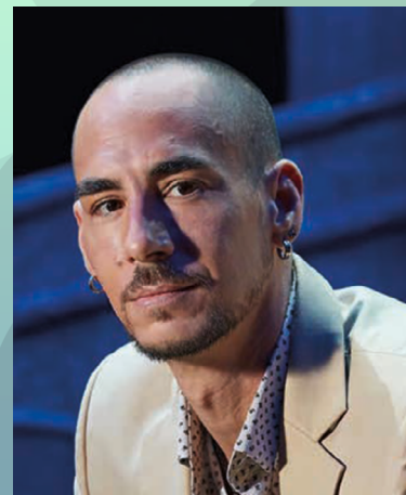
Carl Portal Contemporain