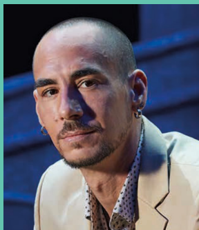
Carl Portal Contemporain